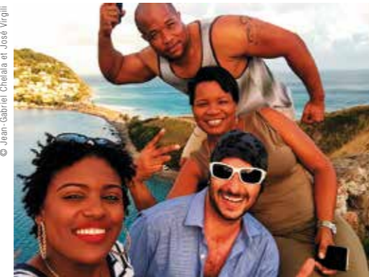
© Jean-Gabriel Chelala et José Virgili

En mars 2016, Jean-Gabriel Chelala et José Virgili quittent leur cadre de vie respectif pour aller à la découverte de l'île de la Dominique en plein cœur des Caraïbes. Sans guide à la main, les sacs à dos bien posés sur les épaules et sans a priori, les deux voyageurs, rodés aux conditions de voyage "précaire", vont sillonner le pays pendant une semaine à la découverte de ses richesses. De rencontres insolites en lieux incontournables, Jean-Gabriel Chelala, suivi comme son ombre par son réalisateur, narre un récit de voyage non exhaustif de la Dominique qui se veut accessible et parlant à tous.