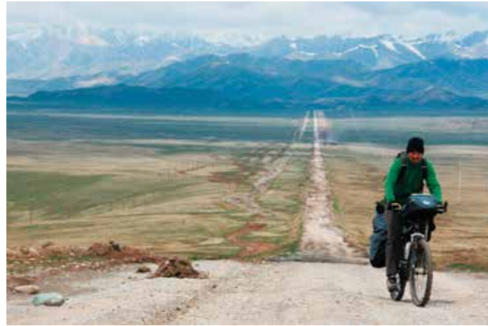
© Lucylle Mucy et Lilian Vezin, Dominique Simonneau et Pascal Hémon, Eliott Schonfeld

Lilian et Lucylle, dans ce film fort et émouvant, nous emmènent à travers les steppes et les montagnes d'Asie centrale. Ils ont parcouru à vélo près de 5 000 kilomètres, soit un périple qui les a menés de l'Ouzbékistan aux vertes vallées des Tian-Shan chinois, en traversant le Pamir tadjik et le Kirghizstan. Un voyage qui n'est pas de tout repos. Il faut passer des dizaines de cols enneigés, affronter le froid et les vents brûlants du désert du Taklamakan, passer entre les mailles d'émeutes opposant le gouvernement de Pékin et les Ouïghours islamiques. La police chinoise mettra un terme à leur aventure alors que la région du Xinjiang est en pleine ébullition. "C'est avant tout pour provoquer des rencontres que nous voyageons". Par chance, tous les peuples sont merveilleux d'hospitalité. Les deux jeunes gens se sont lancés dans ce pari sans préjugé ni certitude. Ils parviennent à communiquer chaleureusement leur passion pour cette région du monde faite de longs déserts, de remparts rocheux et de montagnes indomptables. Aventure en Asie centrale n'est en rien l'évocation d'un exploit, simplement le récit émerveillé de voyageurs qui vont de rencontre en rencontre, avec la naïveté de ceux qui ne savent ce qu'ils cherchent.